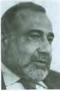
الدكتور عادل مهدي، العضو القيادي في المجلس الأعلى للتورة الإسلامية في العراق والمساعد البارز في مجلس الحكم